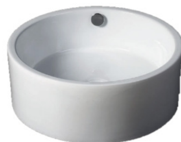
Keramické umyvadlo *

Materiál: Glazovaná keramika Sedátko s funkcí soft close Rozměry: 370x370x550 mm