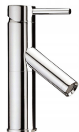
Umyvadlová baterie - vysoká