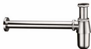
Umyvadlový sifon baňka