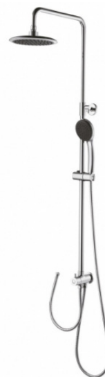
Sprchový sloup nástěný